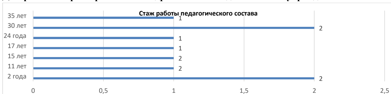
Диаграмма с характеристиками кадрового состава дошкольного учреждения

В 2023 – 2024 учебном году педагоги МДОАУ д/с № 11 приняли участие в: